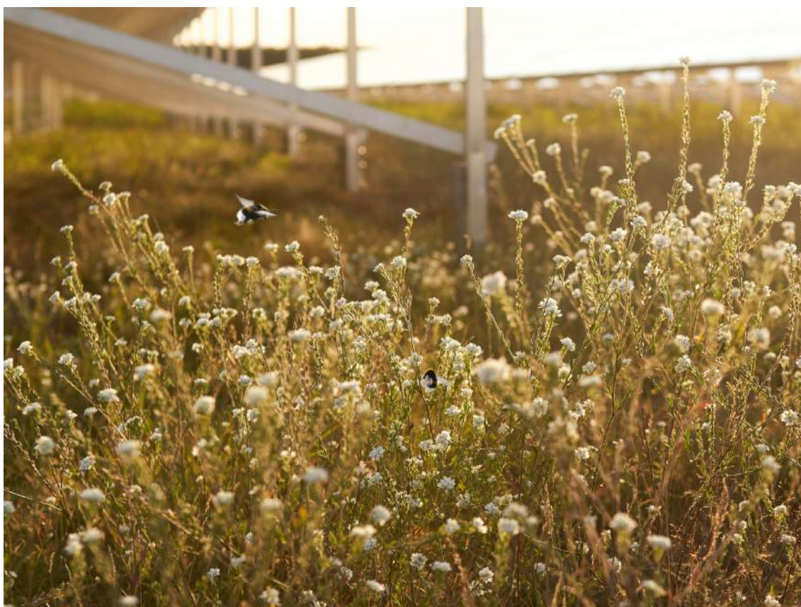
Bildquelle und Copyright: Bundesverband Neue Energiewirtschaft, Sept. 2020